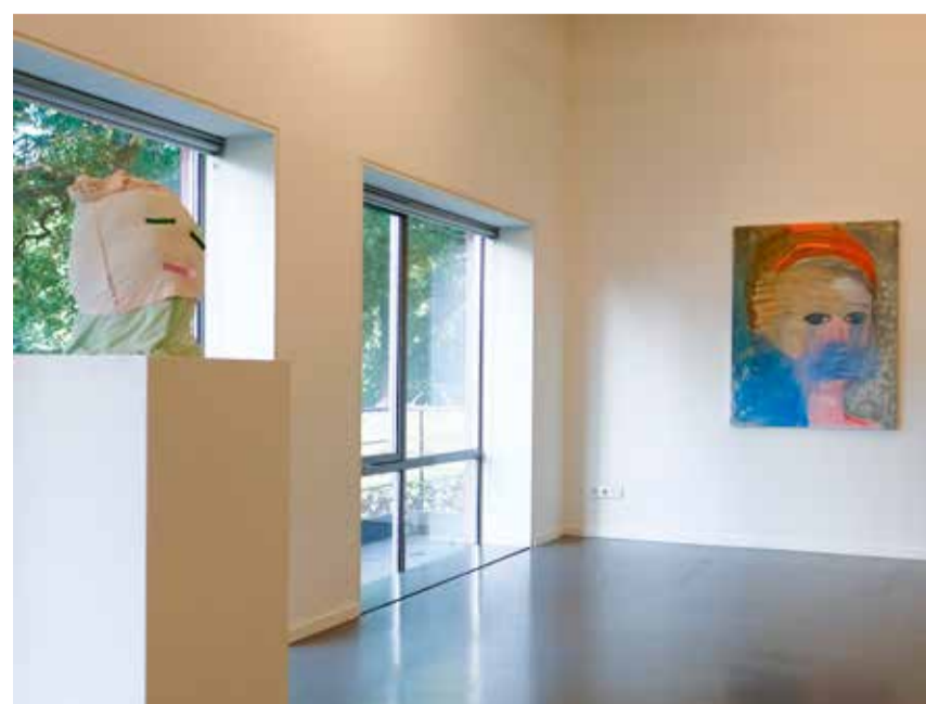
Werk van Wietske Lycklama à Nijeholt in de Kleine Zaal.