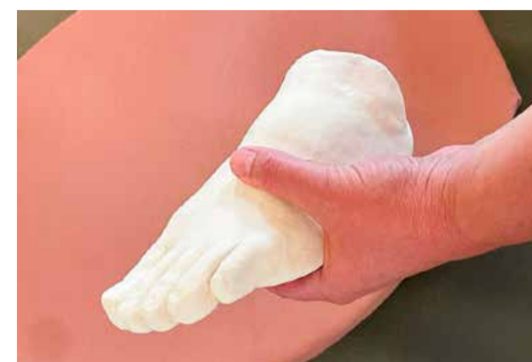
Werk van Wiesje Gunnink met hand van de kunstenaar.