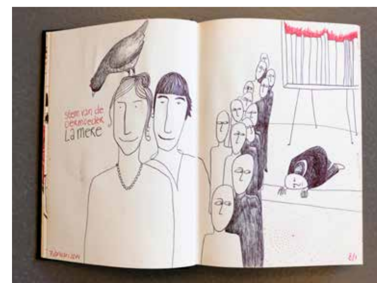
Dagboektekening van Judith Schmidt.

■ Kunstenaars IN BEELD - Het maakproces in beeld T/m 6 maart CBK Emmen - De Fabriek Ermerweg 88b Emmen Gratis entree Do t/m zo 13 -17 uur (ook open op Tweede Kerstdag) cbkemmen.nl